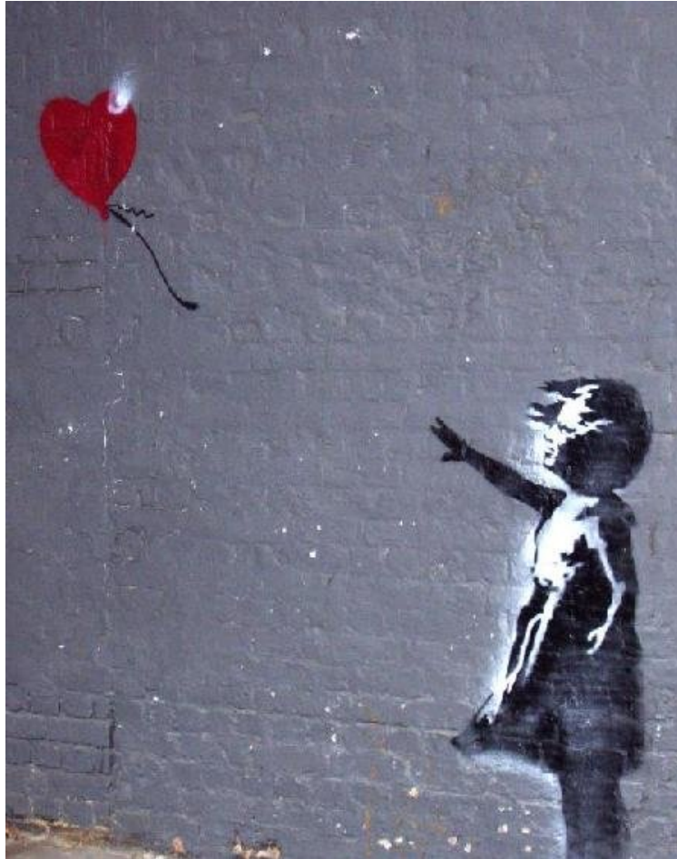
Robin Gunningham, conosciuto con lo pseudonimo di Banksy

Scegliamo il nostro mondo successivo in base a ciò che noi apprendiamo in questo. Se non impari nulla, il mondo di poi sarà identico a quello di prima, con le stesse limitazioni. Richard Bach